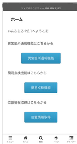
図-1 いんふらろぐ 2.1

図-1 にホーム画面を示す。「いんふらろぐ 2.1」は、「いんふらろぐ 2」での問題点を解消することを目的として開発したものであり、構築環境や、使用するソフトウェアなどを変更し、これまでの問題であった、