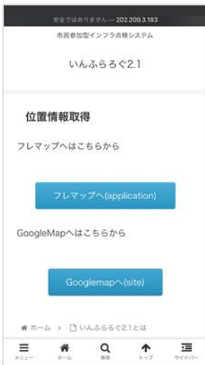
図-5 Google Map と フレマップへ飛ぶボタン