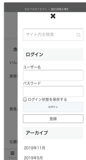
図-2 ログインページ