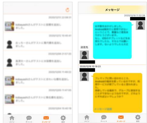
図-8 フレマップのメッセージ機能

「フレマップ」は、プライベートマップを作成することが可能な既存のアプリケーションである。「フレマップ」と Google Map の違いとしては、Google Map は飲食店や、駅などといったたくさんの情報を持ったマップなのに対し、「フレマップ」は個人が好きなものについてピンを立て、自分好みのマップを作成することが可能である。この機能を利用し、図-7 に示すような橋梁についての情報のみのマップを作成することにより、