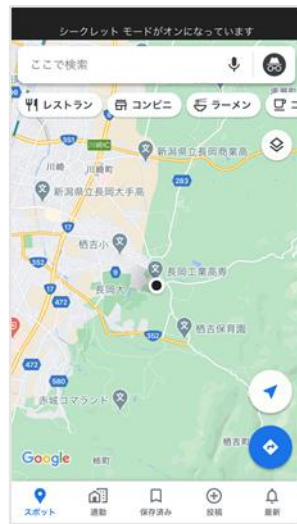
図-6 Google Map