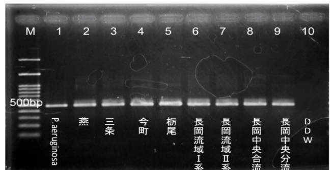
図-2 アガロースゲル電気泳動

M:Ladder Maker, 1:P.aeruginosa, 2-9:活性汚泥, 10:DDW